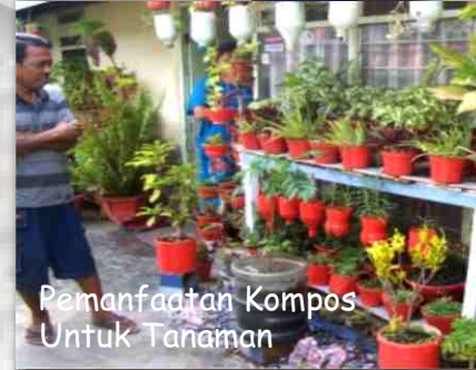
Pemanfaatan Kompos Untuk Tanaman